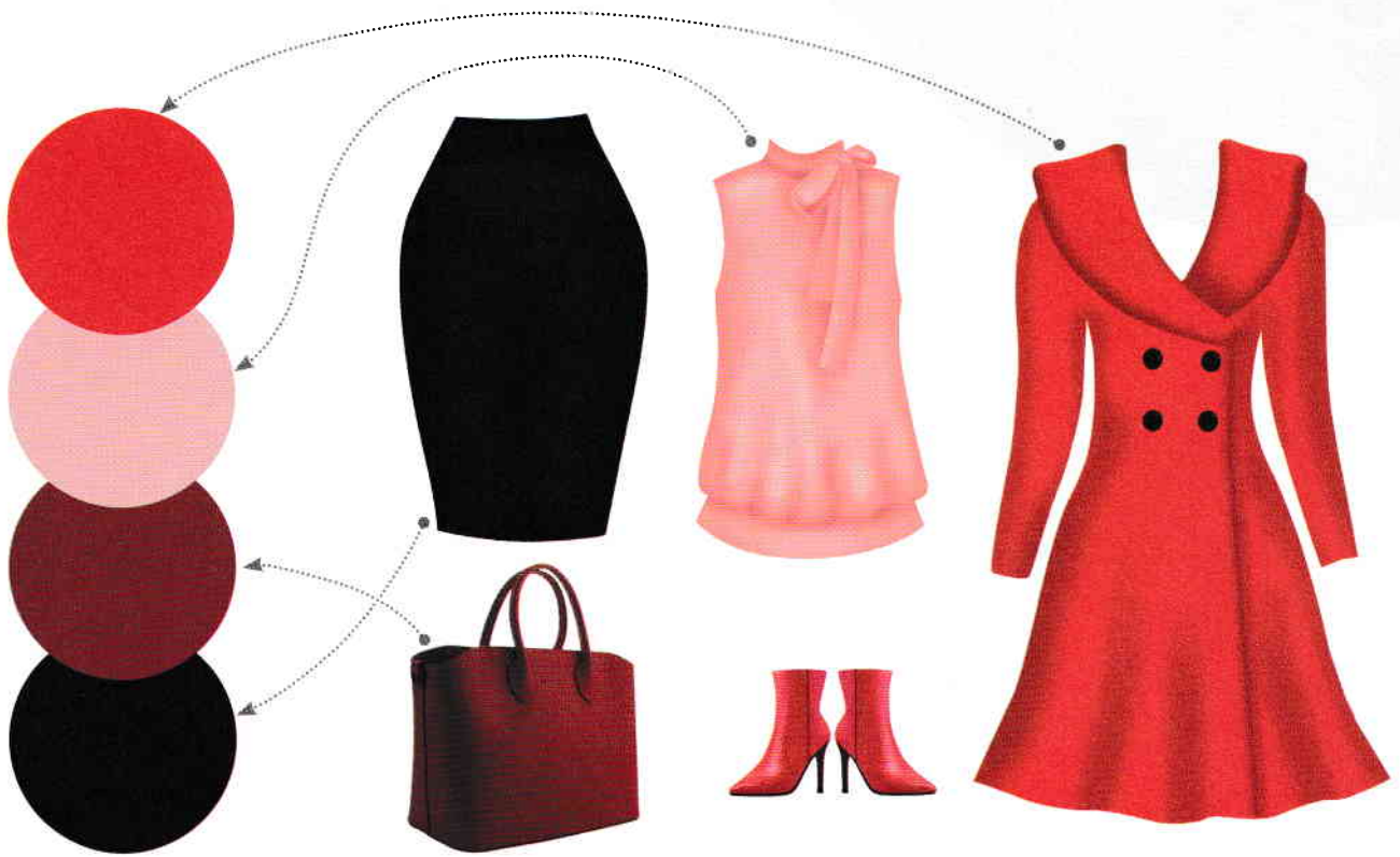
PALETA CROMATICĂ 1

Privește atent combinația de culori a ținutelor de mai jos. Ea este reprezentată prin paleta cromatică alăturată. Observă ce culoare lipsește în paleta 2. Colorează.