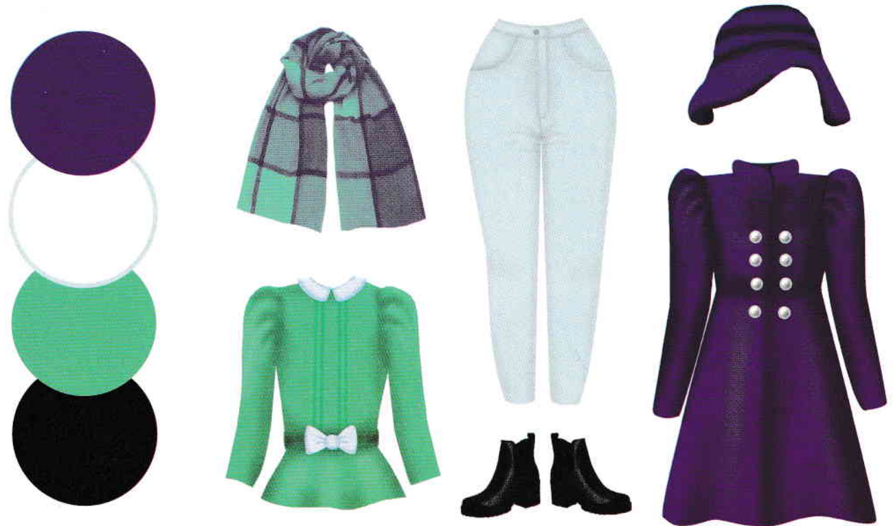
PALETA CROMATICĂ 2